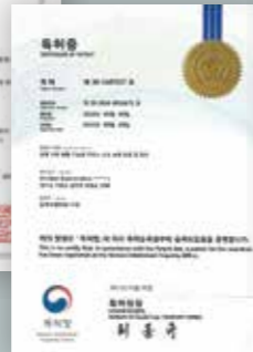
특허 제 10-1647017